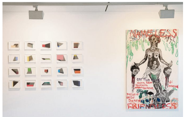
Per Stian Monsås står bak verket «(U)tydelig arkitektur», og Julie Ebbing har laget verket «Septic Cunt», linosnitt, oljemaling.