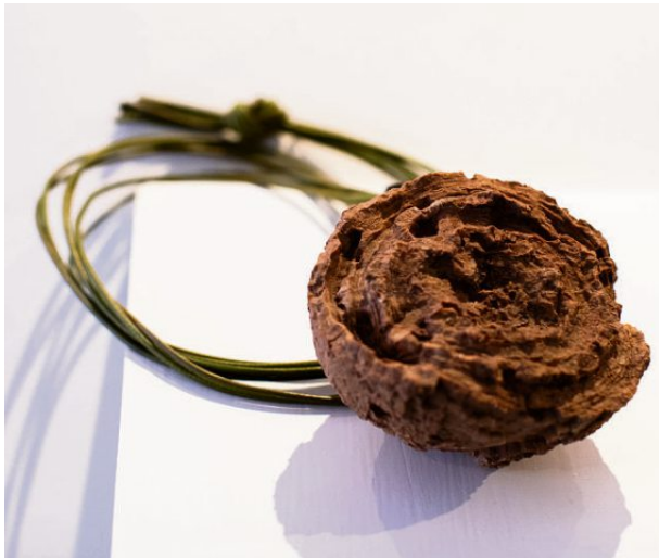
Zieglers kunstneriske arbeider med mandalaer, steinalder-redskaper og meteoritter