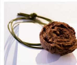
Zieglers kunstneriske arbeider med mandalaer, steinalder-redskaper og meteoritter