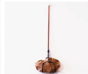
Reinhold Ziegler lager smykker med elementer han mener kan bringe oss tilbake til vår egen natur, som gamle fossiler og steinalderredskap.