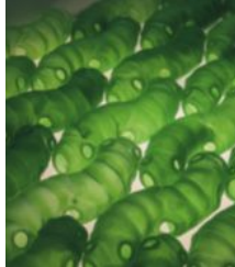
Mose: Skjelbreia har laget sin versjon av mose i epoxy, sett fra et mikroskopisk perspektiv.